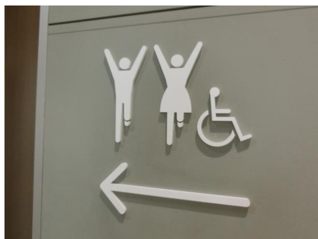
トイレマークもグリコ仕様