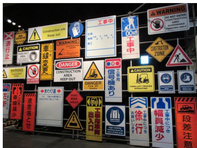
各種工事看板の展示もありました